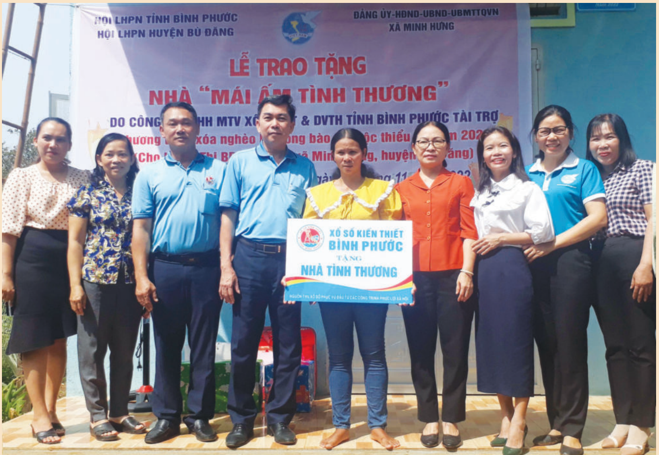
Công ty TNHH MTV Xổ số kiến thiết và Dịch vụ tổng hợp Bình Phước tặng nhà tình thương cho đồng bào nghèo

Bên cạnh việc ra sức thi đua hoàn thành tốt nhiệm vụ kinh doanh, Công ty TNHH MTV Xổ số kiến thiết và Dịch vụ tổng hợp Bình Phước còn tích cực thực hiện các hoạt động từ thiện, an sinh xã hội, đền ơn đáp nghĩa. Cụ thể, Công ty đã tài trợ xây dựng nhà tình thương; tặng quà cho người nghèo và người bán vé số lẻ nhân dịp Tết nguyên đán Quý Mão năm 2023; hỗ trợ thăm hỏi chiến sĩ Trường Sa;