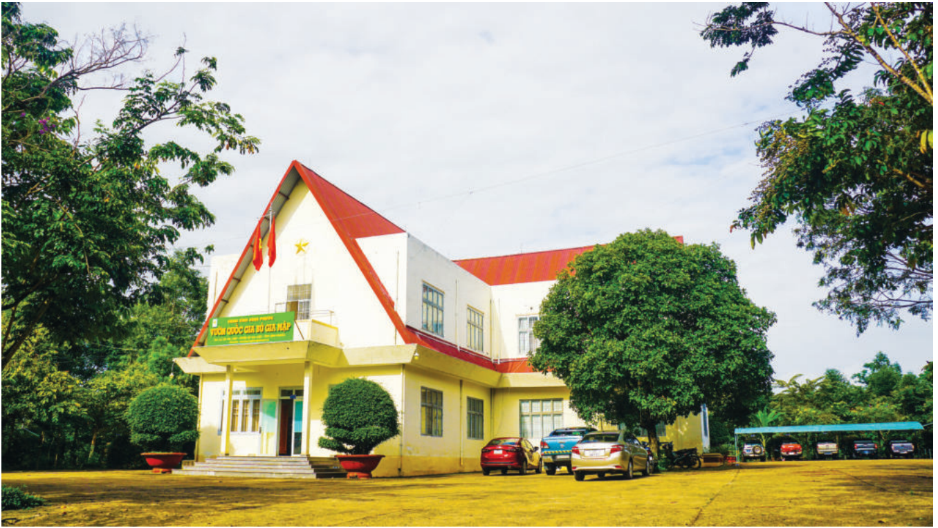
Trụ sở Ban quản lý Vườn Quốc gia Bù Gia Mập

nghiên cứu khoa học. Đến nay, đã có 5 đề tài cấp tỉnh được đơn vị thực hiện. Công tác cứu hộ, bảo tồn và phát triển các loài sinh vật cũng được chú trọng, khi đã có hàng ngàn cá thể động vật hoang dã được cứu hộ, chăm sóc, thả về môi trường tự nhiên. Qua 20 năm thành lập, không chỉ hoàn thành tốt trách nhiệm trong công tác bảo tồn, phát triển đa dạng sinh học của rừng, VQG Bù Gia Mập cũng đã thực hiện hoàn chỉnh cơ cấu nguồn nhân lực hiệu quả. Hiện lực lượng kiểm lâm của VQG Bù Gia Mập có 54 cán bộ, nhân viên, trong đó có 30 công chức và 24 nhân viên lao động hợp đồng được bố trí tại Văn phòng Hạt kiểm lâm, 1 tổ kiểm lâm cơ động và phòng cháy, chữa cháy rừng, 11 trạm kiểm lâm và 7 chốt bảo vệ rừng. Ngoài ra, còn có gần 600 hộ dân vùng đệm đang tham gia nhận khoán bảo vệ rừng đóng ở 12 chốt.