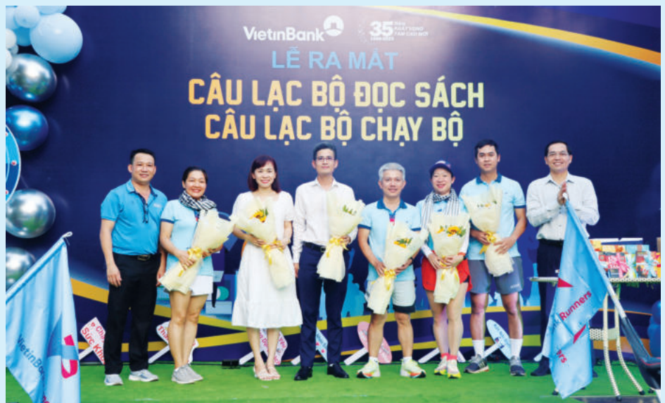
Lễ ra mắt Câu lạc bộ đọc sách, Câu lạc bộ chạy bộ của Vietinbank Bình Phước