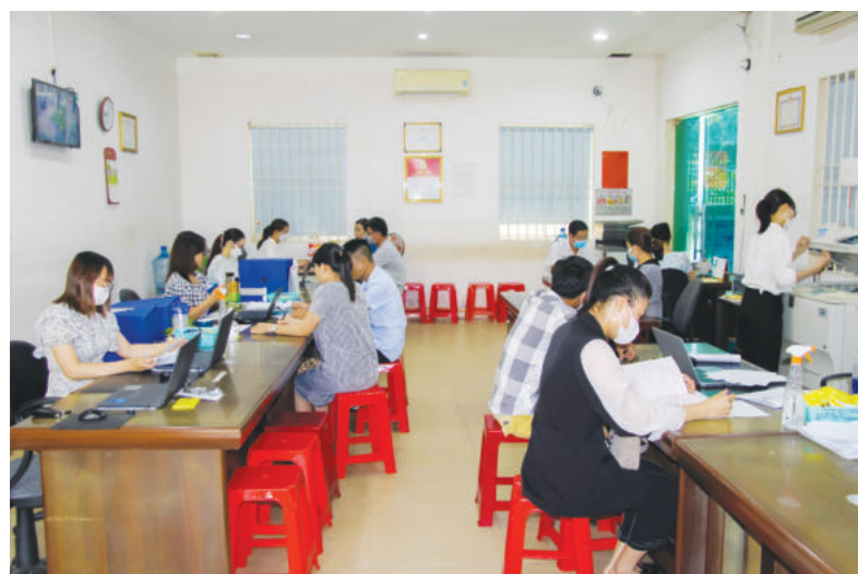
Đội ngũ công chứng viên, cán bộ nghiệp vụ của Phòng Công chứng số 01 tỉnh Bình Phước tiếp nhận và giải quyết hồ sơ công chứng, chứng thực

Ngoài ra, trong bối cảnh xã hội hóa, ngoài dịch vụ trọng tâm đặt vào nghiệp vụ công chứng, Phòng Công chứng số 01 tỉnh Bình Phước cũng chú trọng về tác phong, thái độ trong khi giao tiếp với người dân, tổ chức, doanh nghiệp nhằm tạo nên sự thoải mái, gần gũi với khách hàng, tạo sự tin tưởng, chuyên nghiệp và mang đến sự hài lòng cao nhất. ■