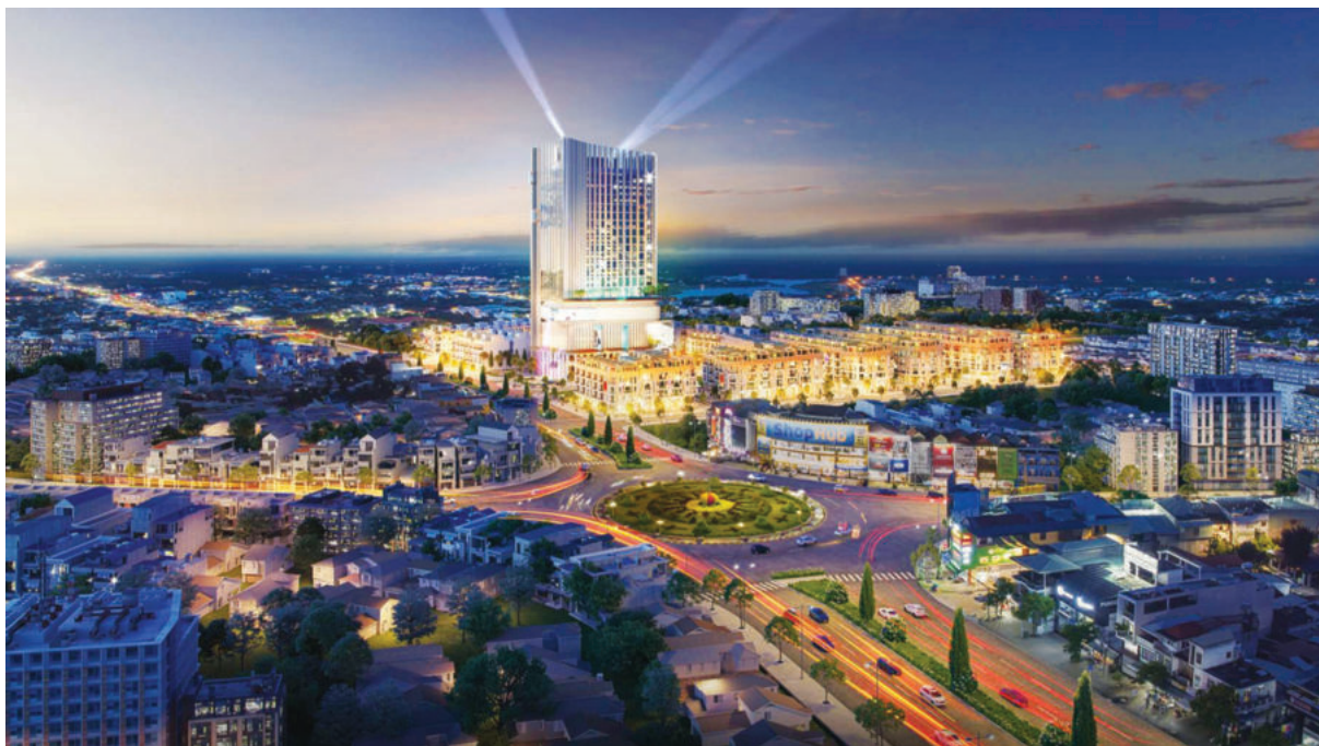
The Light City - Dự án thay đổi diện mạo thành phố Đồng Xoài