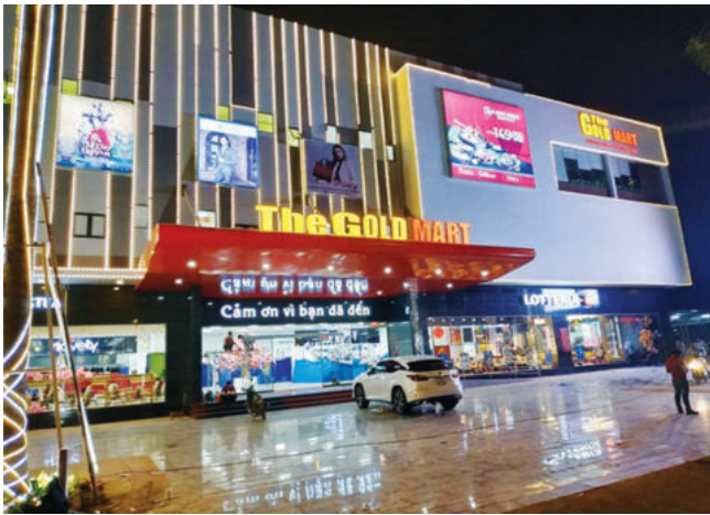
Trung tâm thương mại The Gold Mart

hành chính – thương mại – dịch vụ “cao cấp” nhất tại đây nói riêng và tỉnh Bình Phước nói chung.