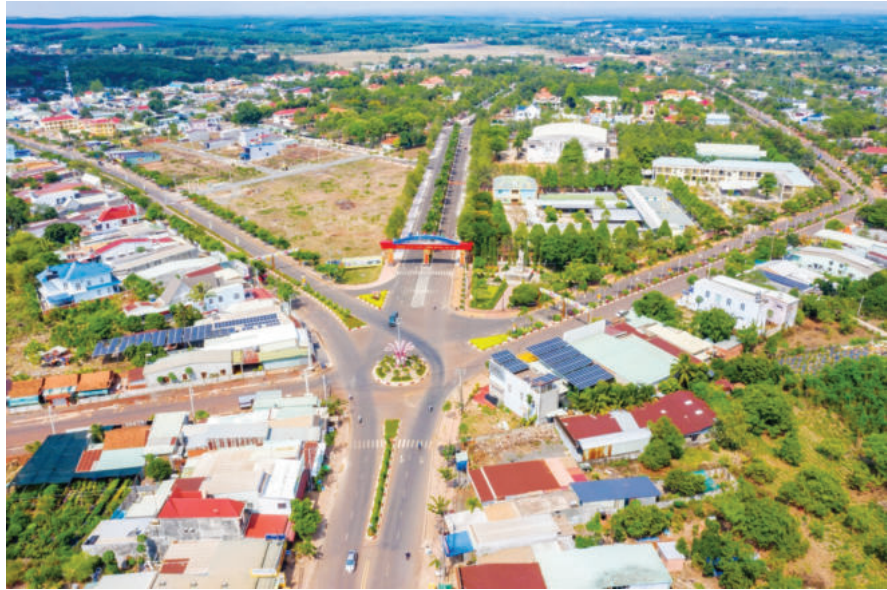
Thị trấn Thanh Bình là trung tâm chính trị - kinh tế - văn hóa của huyện Bù Đốp

“Để thực hiện hiệu quả công tác thu hút đầu tư, lãnh đạo huyện thường xuyên chỉ đạo các phòng, ban, địa phương đẩy mạnh cải cách thủ tục hành chính, ứng dụng mạnh mẽ công nghệ thông tin và xây dựng chính quyền điện tử đảm bảo liên