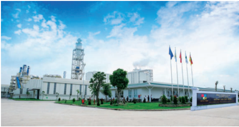
Toàn cảnh nhà máy sản xuất ván MDF của Công ty CP FSC Việt Nam