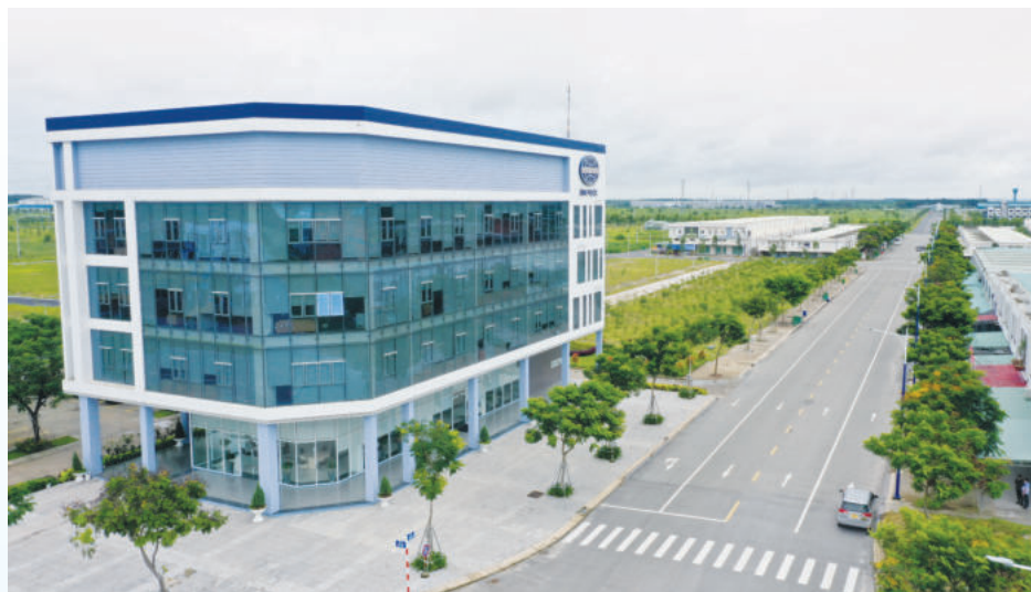
Văn phòng Công ty Becamex – Bình Phước

Là một trong các dự án trọng điểm của tỉnh Bình Phước, Khu công nghiệp (KCN) và dân cư Becamex - Bình Phước được kỳ vọng sẽ trở thành hạt nhân lan tỏa thu hút đầu tư, góp phần vào sự phát triển kinh tế - xã hội và giải quyết việc làm cho lao động địa phương. Bên cạnh mục tiêu phát triển kinh tế, khu liên hợp công nghiệp - dịch vụ - đô thị Becamex Bình Phước còn là biểu tượng cho sự gắn bó giữa hai tỉnh "anh em" Bình Dương - Bình Phước để cùng hợp tác, hỗ trợ nhau phát triển.