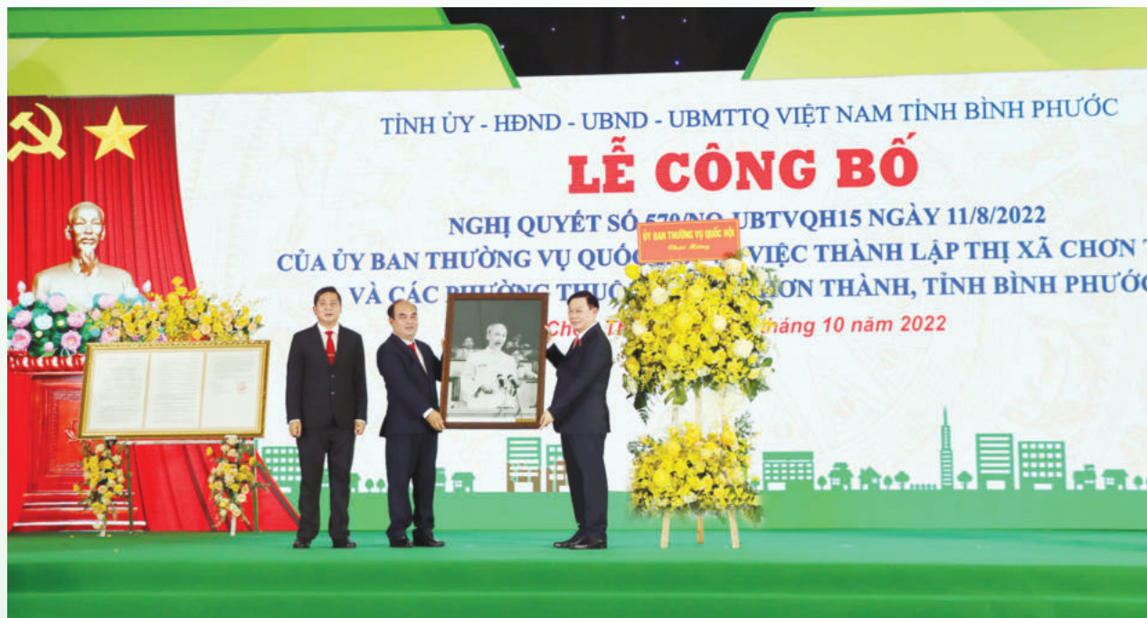
Chủ tịch Quốc hội Vương Đình Huệ tặng ảnh Bác Hồ, hoa chúc mừng Đảng bộ, chính quyền, dân và quân thị xã Chơn Thành nhân dịp công bố nghị quyết về việc thành lập thị xã Chơn Thành và các phường thuộc thị xã vào tháng 10/2022