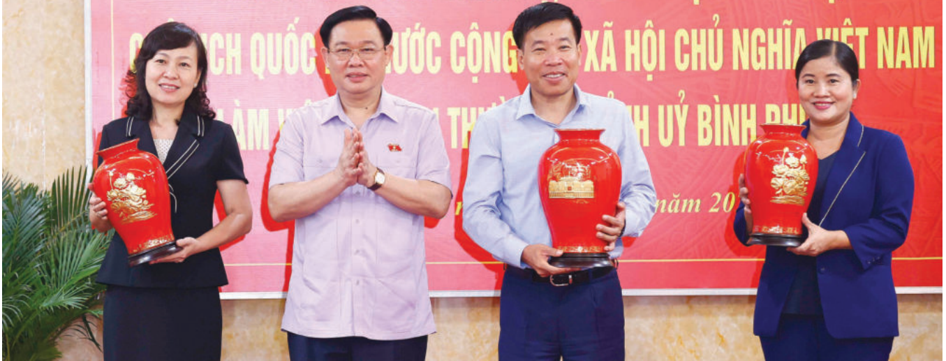
Chủ tịch Quốc hội Vương Đình Huệ tặng quà lưu niệm lãnh đạo tỉnh Bình Phước nhân dịp Chủ tịch Quốc hội và Đoàn công tác làm việc với Ban Thường vụ Tỉnh ủy Bình Phước vào tháng 10/2022