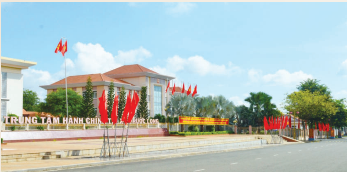
Một góc Trung tâm hành chính thị xã Phước Long

Xây dựng, cải tạo và nâng cấp đồng bộ hệ thống kết cấu hạ tầng đô thị, đảm bảo kiểm soát chất lượng môi trường, hài hòa, cân bằng giữa chỉnh trang đô thị cũ và phát triển đô thị mới. Phát triển bảo đảm phù hợp với quy hoạch tỉnh, kế hoạch và chiến lược phát triển kinh tế - xã hội của tỉnh. Phát huy lợi thế vị trí là trung tâm thương mại, dịch vụ, du lịch phía Bắc của tỉnh, kịp thời nắm bắt các cơ hội thu hút đầu tư, thúc đẩy nhanh quá trình đô thị hóa; tiếp tục phát huy tinh thần đoàn kết, thống nhất, chủ động, sáng tạo; huy động tất cả nguồn lực để tạo sự đột phá trong phát triển kinh tế nhanh và bền vững.