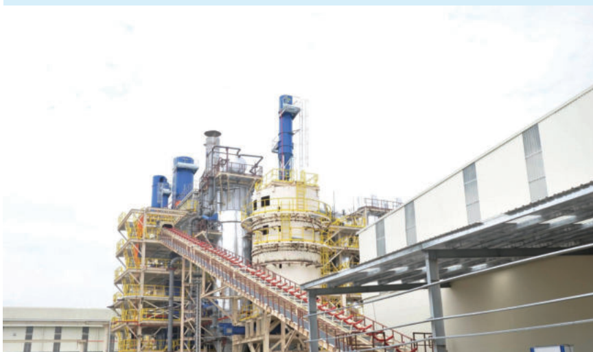
The MDF board factory is equipped with modern, environmentally friendly technology and machinery

"This is the time when businesses must exert their strongest spirit, willpower, creativity and elasticity in production models and capture every opportunity to recover and develop business operations. And with its experience in overcoming difficulties and flexibly adapting to new developments, FSC Vietnam is confidently and firmly aspiring development and making an important contribution to the economic growth of Binh Phuoc province," he affirmed. ■