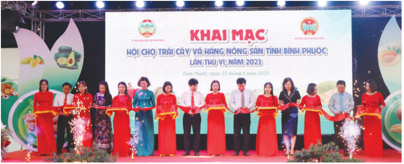
Bí thư Tỉnh ủy Bình Phước - ông Nguyễn Mạnh Cường và các đại biểu cắt băng khai mạc Hội chợ trái cây và hàng nông sản tỉnh Bình Phước

hiện Đề án phát triển hệ thống thương mại, TMĐT và thương mại biên giới tỉnh Bình Phước giai đoạn 2021 - 2025, định hướng đến năm 2030. Sở đã làm việc với UBND cấp huyện để rà soát, lựa chọn nhu cầu phát triển hạ tầng thương mại, TMĐT và thương mại biên giới trong thời gian tới. Trên cơ sở đó, lập danh mục các dự án đầy đủ cơ sở pháp lý, sẵn sàng GPMB, có cơ hội phát triển nhanh, bền vững để tham mưu UBND tỉnh kêu gọi thu hút đầu tư năm 2023 và những năm tiếp theo. Đôn đốc các lực lượng chức năng tại cửa khẩu, Ban Quản lý khu kinh tế, UBND 03 huyện biên giới phối hợp rà soát để xuất nội dung, các vấn đề phát sinh trong giải quyết những khó khăn, vướng mắc tại cửa khẩu, biên giới, những hạn chế trong hoạt động giao thương, xuất nhập khẩu biên mậu, công tác quản lý cửa khẩu và nhiệm vụ của địa phương trong phát triển thương mại biên giới để tham mưu UBND tỉnh chỉ đạo thực hiện. Đồng thời, thúc đẩy nhanh việc ứng dụng của doanh nghiệp (DN) và thay đổi thói quen tiêu dùng truyền thống của người dân nhằm đẩy mạnh phát triển TMĐT; thông qua Cục Quản lý thị trường tỉnh đẩy mạnh quản lý, kiểm tra, xử lý vi phạm kinh doanh hàng hóa trên các website TMĐT, các trang mạng xã hội.