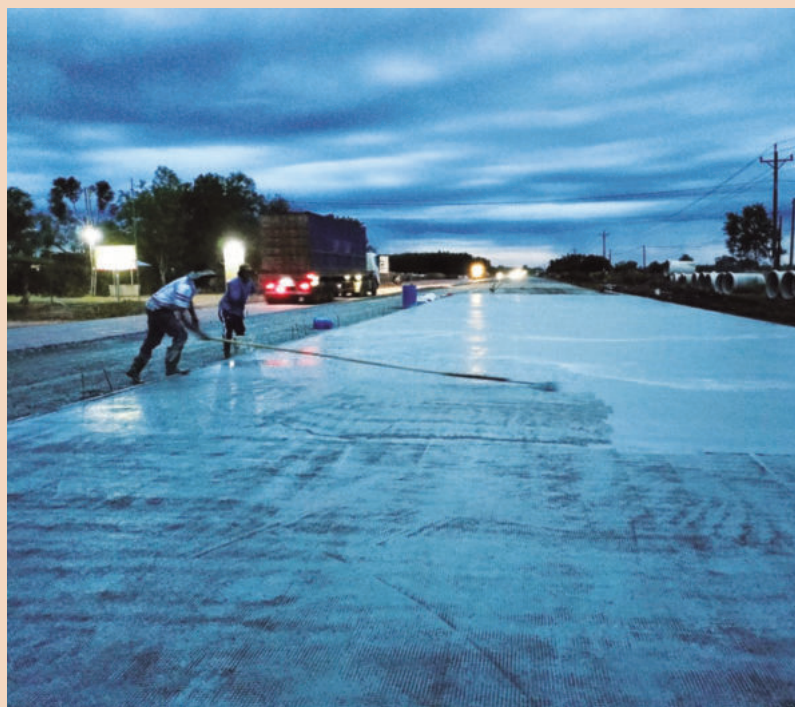
Road construction on the western side of National Highway 13 to connect Chon Thanh and Hoa Lu