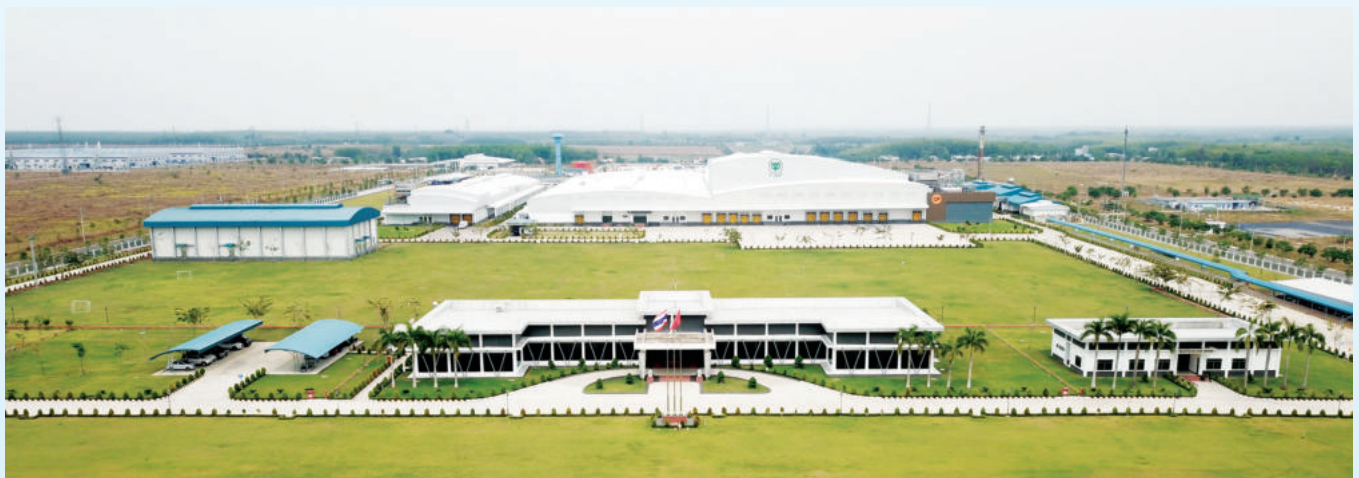
Dự án nhà máy Công ty CPV Food tại Khu công nghiệp Becamex – Bình Phước

Địa chỉ: Ô 2,3,4,5,6 Lô TDC33, Đường D3B, KDC Ấp 4B, Phường Minh Thành, Thị Xã Chơn Thành, Tỉnh Bình Phước. Điện thoại: (02713) 640 079 / Fax: (02713) 640 080 Email: info@becamexbinhphuoc.com.vn