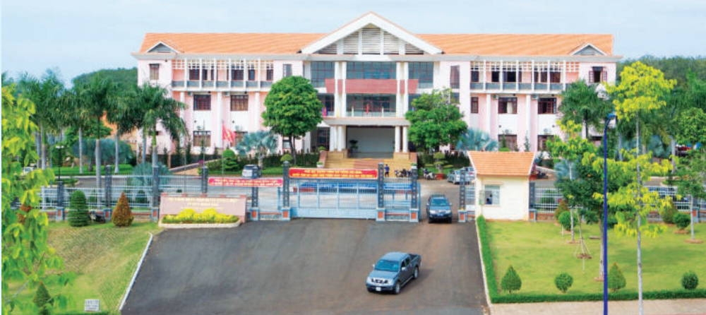
Trung tâm hành chính huyện Bù Gia Mập

xây dựng nông thôn mới, tập trung nguồn lực đầu tư xã Đăk Ô về đích nông thôn mới trong năm 2023.