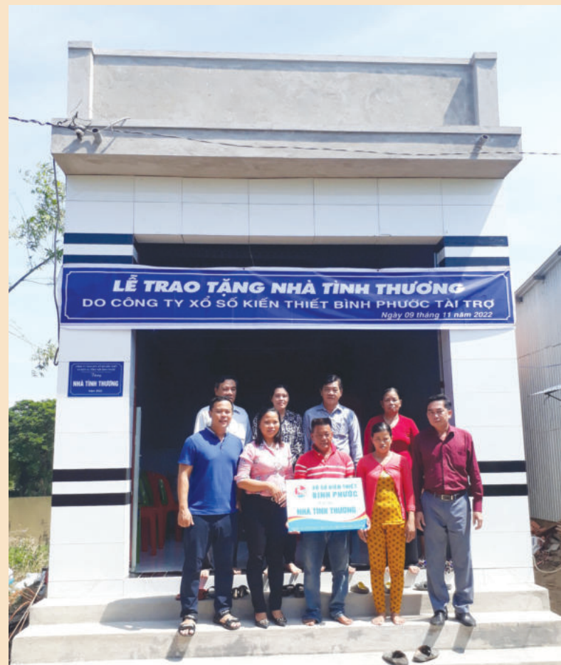
Công ty TNHH MTV Xổ số kiến thiết và Dịch vụ tổng hợp Bình Phước tài trợ nhà tình thương cho bà con

Từ những thành tựu đã đạt được, trong năm 2023 Công ty TNHH MTV Xổ số kiến thiết và Dịch vụ tổng hợp Bình Phước tiếp tục triển khai những định hướng nhằm tạo đà tăng trưởng, đảm bảo hoạt động kinh doanh hiệu quả, ổn định đời sống và việc làm cho người bán lẻ, đem lại may mắn cho khách hàng, tích cực đóng góp vào ngân sách nhà nước. ■