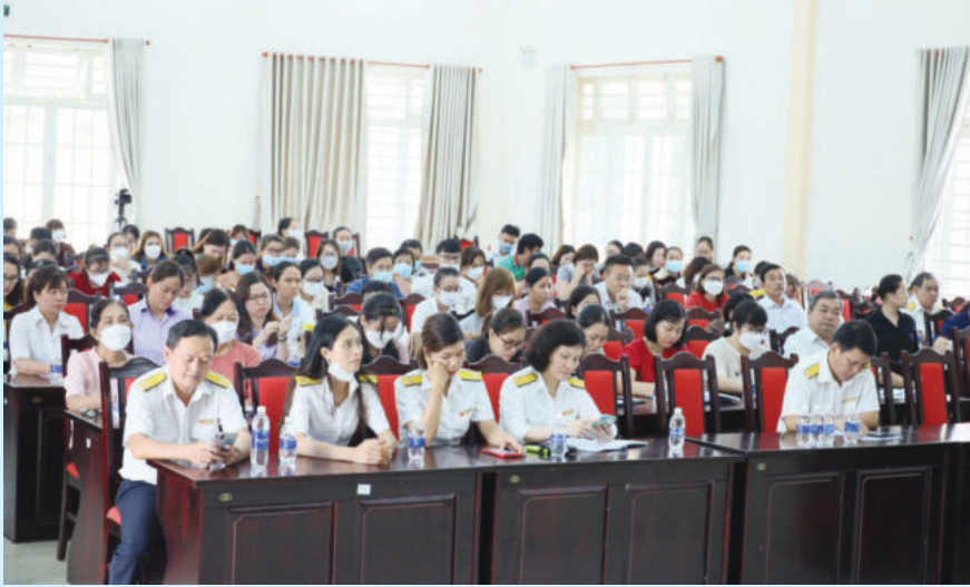
Hội nghị đối thoại với doanh nghiệp tại huyện Hớn Quản

Năm 2023, Cục Thuế tỉnh Bình Phước được Bộ Tài chính giao dự toán thu ngân sách nhà nước (NSNN) là 13.327 tỷ đồng, UBND tỉnh giao là 14.910 tỷ đồng. Đơn vị triển khai nhiệm vụ trong điều kiện nhiều thuận lợi và khó khăn, thách thức đan xen. Phát huy những thành tích đã đạt được, cán bộ, công chức ngành Thuế tỉnh tiếp tục nêu cao tinh thần trách nhiệm, năng động sáng tạo, đổi mới phong cách làm việc, đẩy mạnh cải cách hành chính, tăng cường tuyên truyền, tư vấn hỗ trợ đối tượng nộp thuế, phấn đấu hoàn thành vượt mức dự toán được giao.