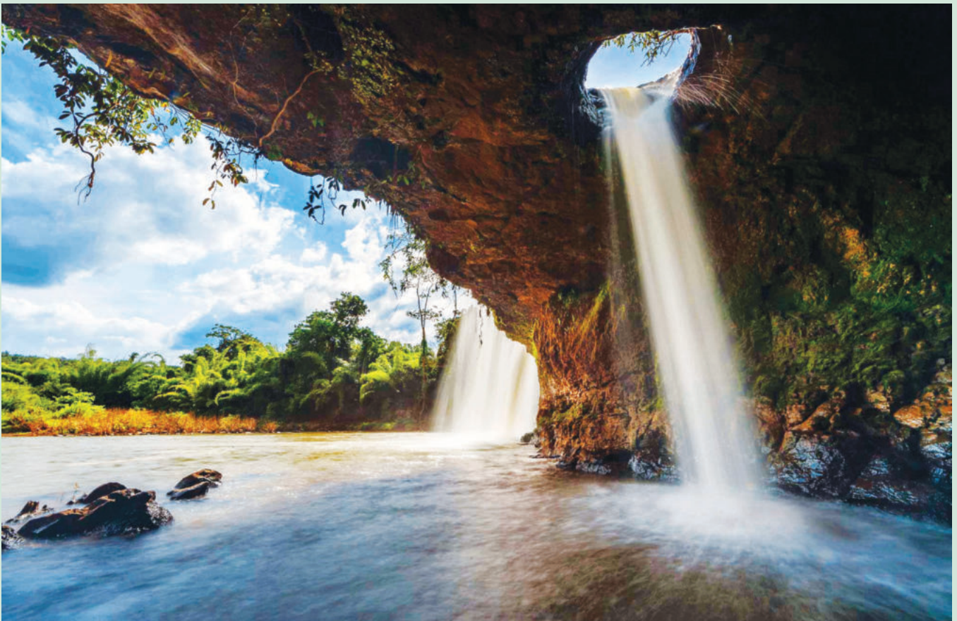
Dak Mai Waterfall

Covering 25,598.18 ha, Bu Gia Map National Park is the only continuous forest area with large plant and animal reserves in Binh Phuoc province. This place preserves ecological standard samples and rare, valuable genetic resources of tropical fauna and flora, indigenous for the