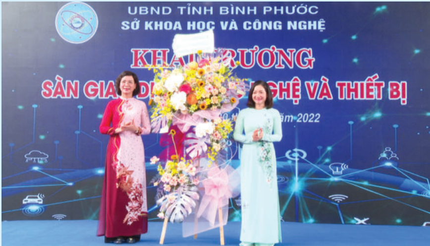
Khai trương Sàn giao dịch công nghệ và thiết bị tỉnh Bình Phước