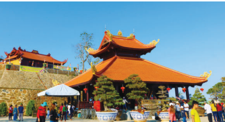
Di tích núi Bà Rá là điểm du lịch nổi tiếng tại Bình Phước