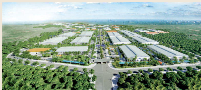
Thanh Phuoc industrial zones are well planned

The project is considered a symbol of modern, classy culture and service in Binh Phuoc. Built on a golden place of 3.3 ha in the heart of Dong Xoai City, The Light City holds the first and largest 18-story Dong Xoai Trade Center in Binh