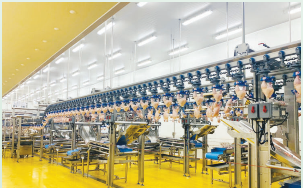
Dây chuyền chế biến bên trong Nhà máy chế biến thịt gà CPV Food tại Bình Phước