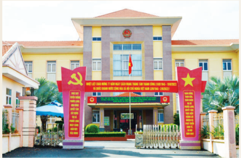
Trụ sở UBND thị xã Phước Long

Thực hiện Chương trình hành động số 17-CTr/TU của Tỉnh ủy về thực hiện Nghị quyết Đại hội XIII của Đảng và Nghị quyết Đại hội Đảng bộ tỉnh lần thứ XI, ngày 18/7/2022, Tỉnh ủy ban hành Kết luận số 413-KL/TU về phát triển đô thị thị xã Phước Long giai đoạn 2021-2025, định hướng đến năm 2030. Kết luận nêu rõ: Phát triển đô thị thị xã Phước Long giai đoạn 2021-2025, định hướng đến năm 2030 theo hướng “sinh thái, bản sắc, văn minh”.