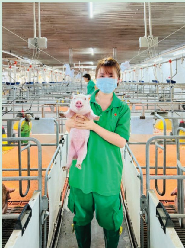
New Hope is one of the leading feed producers in Vietnam

Accordingly, to enhance performance, farms are built with modern technology and advanced equipment. All processes are operated and monitored by an automated system to be cost-effective and environmentally friendly with a wastewater treatment system that is applied with strict standards. With quality-assured feeds, good breeds and international breeding techniques, farms that meet environmental quality requirements not only supply quality meat for consumers, but also ensure profits for