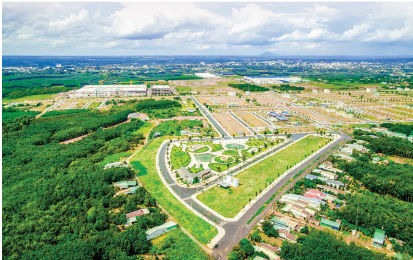
Cát Tường Phú Hưng là khu đô thị phức hợp - cảnh quan đầu tiên tại Bình Phước do Cát Tường Group làm chủ đầu tư

Cát Tường Phú Hưng là dự án tiên phong tại thị trường Bình Phước mà chúng tôi đặt rất nhiều tâm huyết.