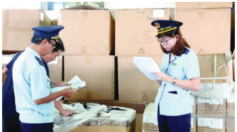
Công chức Cục Hải quan tỉnh Bình Phước kiểm tra hàng hóa tại kho lưu trữ

Bên cạnh đó, Cục cũng tiếp tục nâng cao nhận thức, trách nhiệm và chất lượng đội ngũ cán bộ, công chức, đảm bảo tiêu chuẩn về trình độ, năng lực phẩm chất, nắm vững các quy định của pháp luật thuộc lĩnh vực phụ trách, đặc biệt là các quy định, quy trình, thủ tục giải quyết công việc để vận dụng sáng tạo, linh hoạt vào điều kiện thực tế của địa phương, đơn vị. Đây được coi là cơ sở để Cục xây dựng đội ngũ cán bộ, đảng viên, công chức và người lao động có phẩm chất, bản lĩnh chính trị vững vàng, có năng lực, trình độ và phương pháp làm việc khoa học, chuyên nghiệp, hiệu quả; tuân thủ pháp luật, kỷ luật, kỷ cương, đáp ứng yêu cầu về cải cách, hội nhập, phát triển và hiện đại hoá hải quan. ■