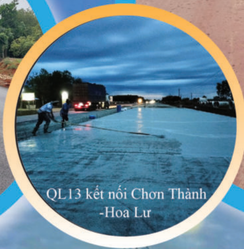
QL13 kết nối Chơn Thành -Hoa Lư