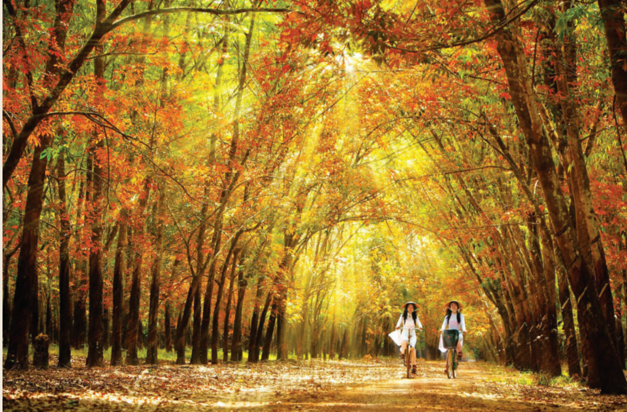
Bu Dang rubber forest is a favored tourist attraction