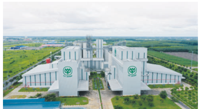
CPV Food Co., Ltd. Project in Becamex – Binh Phuoc IP

Currently, Becamex Phuoc is working with local leaders and Becamex IDC Corporation to organize investment promotion