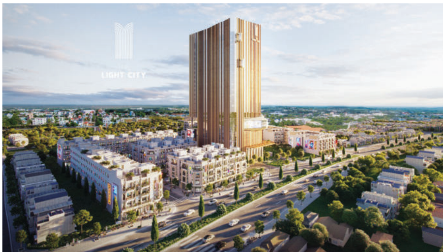
The Light City - Biểu tượng trung tâm thành phố Đồng Xoài

Chính thức tham gia thị trường từ năm 2016, đến nay, Công ty Cổ phần Đầu tư - Bất động sản Thành Phương (Thành Phương Real) đã trở thành đơn vị phát triển hàng đầu tại tỉnh Bình Phước với hàng loạt dự án ở nhiều lĩnh vực, là thương hiệu quen thuộc với người dân cũng như nhà đầu tư tại các tỉnh thành phía Nam nói chung và Bình Phước nói riêng.