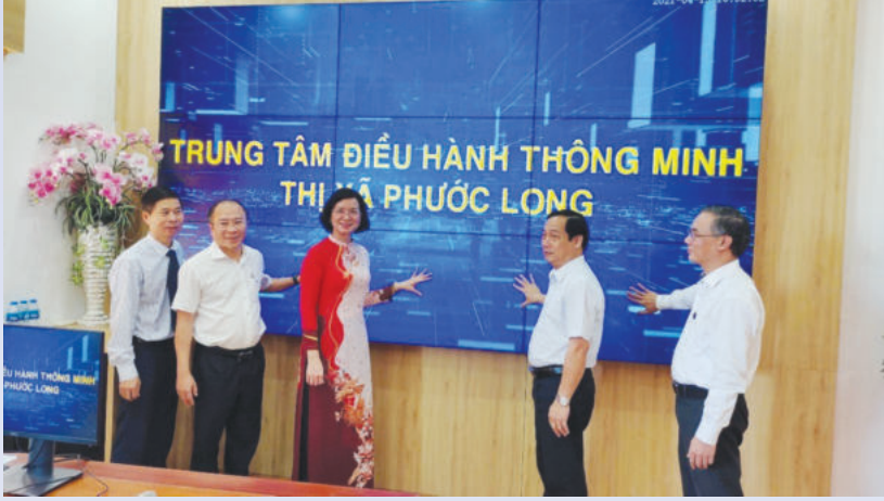
Khai trương Trung tâm Điều hành thông minh thị xã Phước Long

nguồn nhân lực CNTT của Tập đoàn, đây cũng là một lợi thế trong việc tiếp cận, nắm bắt nhu cầu của khách hàng tại địa phương, đồng thời cơ động trong việc triển khai và hỗ trợ chăm sóc khách hàng sau khi đưa sản phẩm vào khai thác.