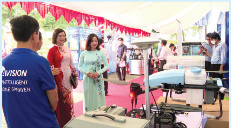
Các đại biểu tham quan sản phẩm khoa học - công nghệ trưng bày tại Sàn giao dịch công nghệ và thiết bị tỉnh Bình Phước

Đặc biệt, nhằm hỗ trợ doanh nghiệp, Sở đã tham mưu UBND tỉnh trình HĐND tỉnh ban hành Nghị quyết số 12/2021/NQ-HĐND ngày 30/9/2021 của HĐND tỉnh quy định chính sách hỗ trợ tổ chức, cá nhân đầu tư, đổi mới thiết bị, công nghệ trên địa bàn tỉnh. Sở KH&CN tiếp nhận thường xuyên các đề xuất nội dung hỗ trợ của các tổ chức, cá nhân theo quy định. Thời gian xem xét các đề xuất hỗ trợ thực hiện hai lần trong năm. ■