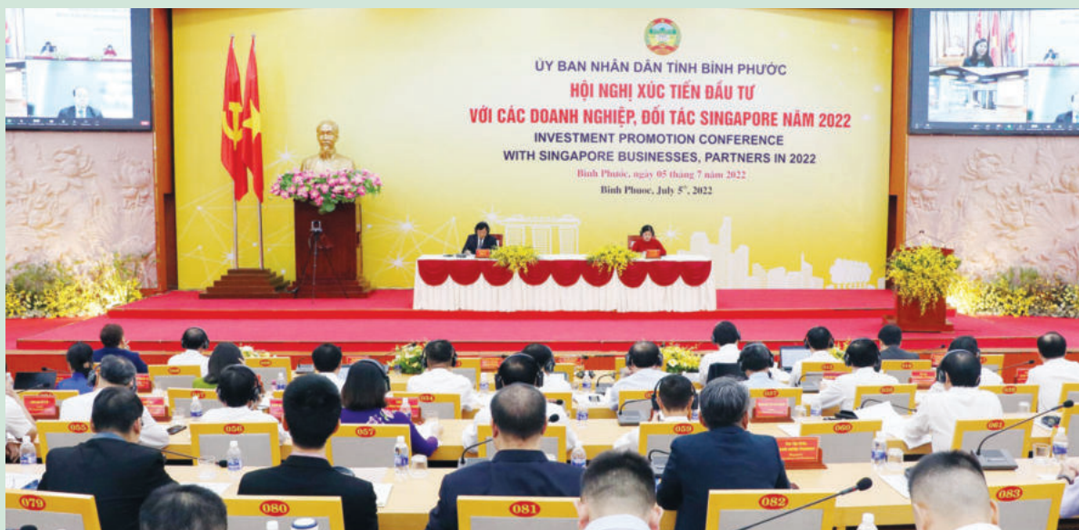
Binh Phuoc province's investment promotion conference with Singapore businesses and partners

introduce potential investment opportunities in the province to domestic and foreign investors, Binh Phuoc has joined many online investment promotion programs launched by the Foreign Investment Agency (FIA) under the Ministry of Planning and Investment.