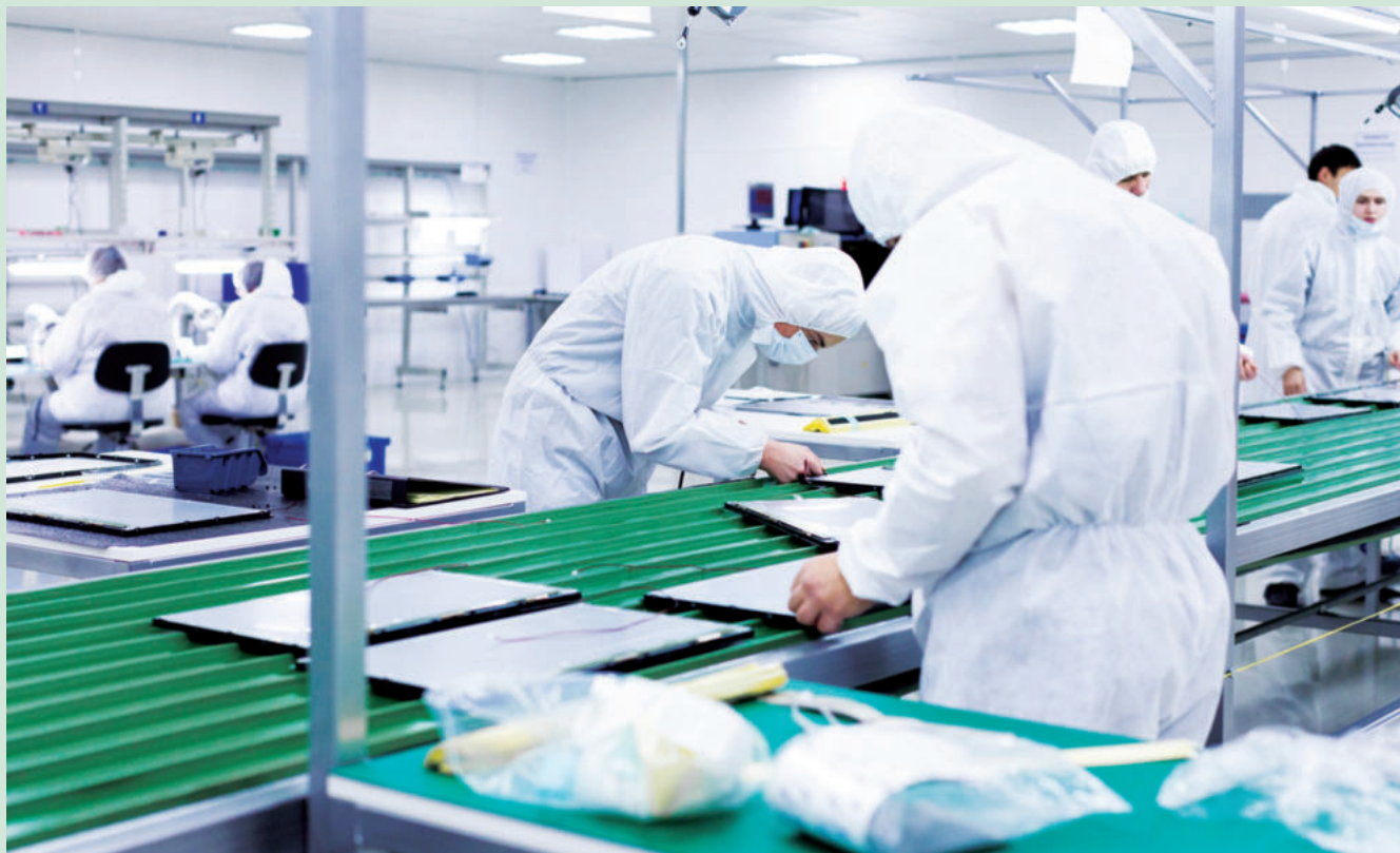
Modifying process innovations to correspond with customer’s green requirements can guarantee a business’s evolution