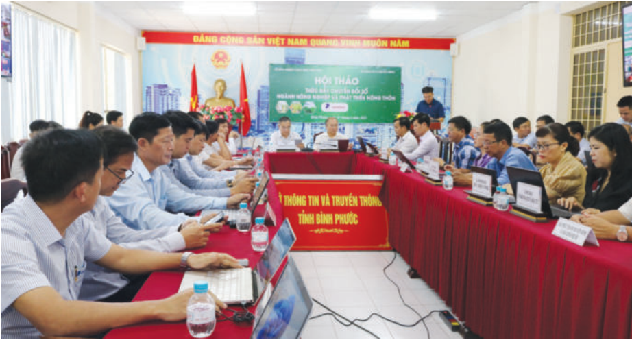
Sở Thông tin và Truyền thông phối hợp Sở Nông nghiệp và Phát triển nông thôn tổ chức Hội thảo thúc đẩy chuyển đổi số ngành Nông nghiệp và Phát triển nông thôn

hoạt động chính quyền số xếp thứ 3/63 tỉnh, thành phố; kế đến là hạ tầng số 8/63; thể chế số 10/63; hoạt động xã hội số 11/63; nhân lực số 13/63. Về xếp hạng 3 trụ cột chính của CDS, chính quyền số xếp thứ 8/63, kinh tế số xếp thứ 14/63, xã hội số xếp thứ 15/63.