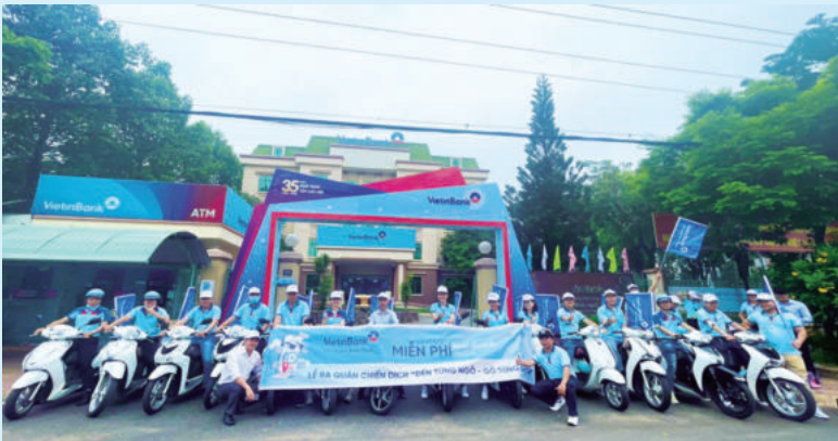
Lễ ra quân chiến dịch “Đến từng ngõ - gõ từng shop” của Vietinbank