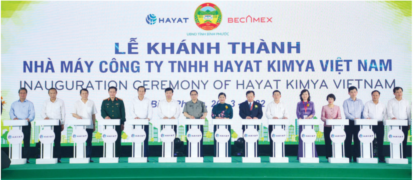
Thủ tướng Phạm Minh Chính và lãnh đạo các bộ, ngành, địa phương thực hiện nghi thức khánh thành nhà máy Hayat Kimya Việt Nam tại Khu liên hợp Công nghiệp - Đô thị - Dịch vụ Becamex Bình Phước vào tháng 3/2022

Những năm gần đây, bên cạnh trực tiếp tổ chức, tham gia các hoạt động XTĐT trong và ngoài nước, Bình Phước áp dụng linh hoạt phương thức XTĐT trực tuyến, đặc biệt trong thời gian chịu ảnh hưởng của dịch bệnh Covid-19. Bên cạnh chủ động trực tiếp tổ chức các sự kiện giới thiệu tiềm năng, cơ hội đầu tư tại tỉnh với các nhà đầu tư trong và ngoài nước, Bình Phước tham gia các Chương trình XTĐT trực tuyến do Cục Đầu tư nước ngoài - Bộ KH&ĐT tổ chức.