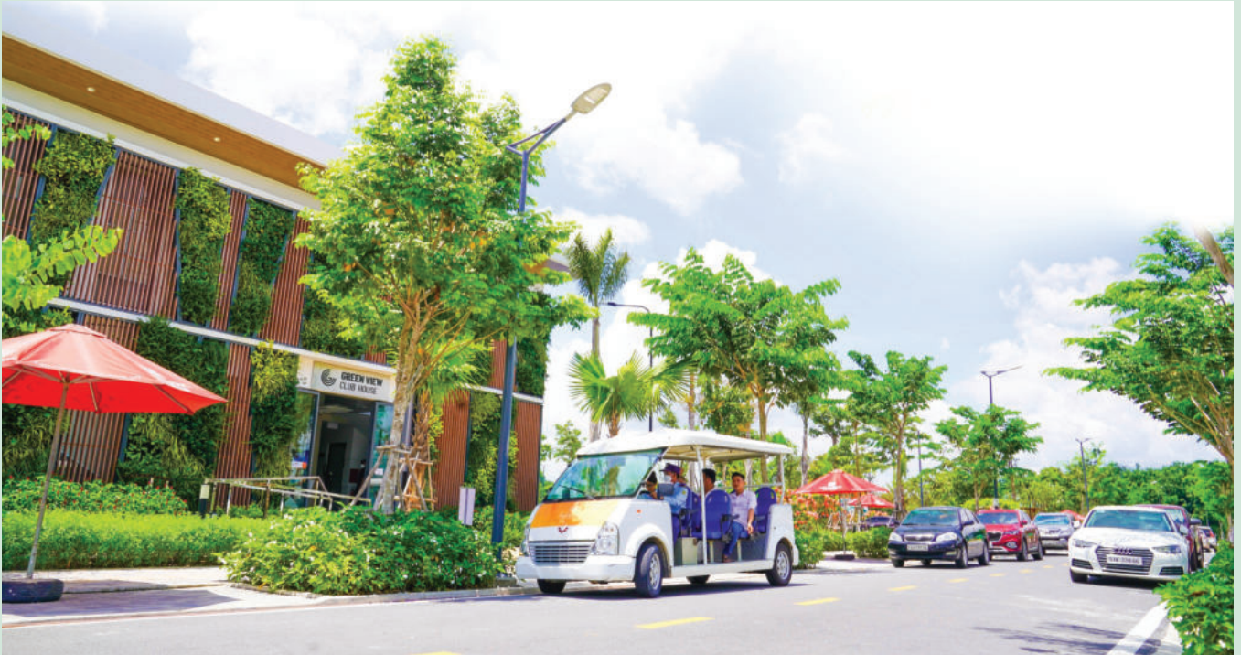
Binh Phuoc real estate market is entering a more stable and sustainable development phase