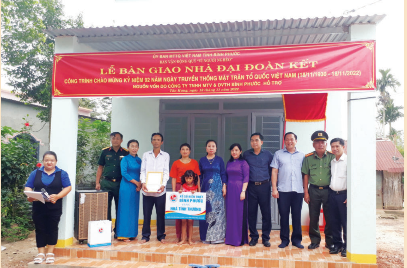
Công ty TNHH MTV Xổ số kiến thiết và Dịch vụ tổng hợp Bình Phước bàn giao nhà đại đoàn kết cho người dân

tài trợ Quỹ khuyến học, khuyến tài, tặng học bổng cho học sinh nghèo; ủng hộ Quỹ vì người nghèo tỉnh Bình Phước; đóng góp vào Quỹ phòng chống thiên tai của tỉnh và các hoạt động từ thiện xã hội khác.