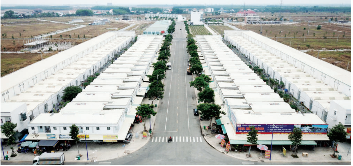
Becamex - Binh Phuoc IP invests heavily in the residential area

Airport (just 1.5-hour drive). The formation of the prospective Trans-Asia Railway will connect Binh Phuoc province with Cambodia, Laos and other countries in the region. This will be a great advantage for importing and exporting commodities through neighboring countries. Additionally, hard soil (foundational reinforcement is not needed) and the altitude of 28-32m above sea level will help investors reduce construction costs by about 30%.