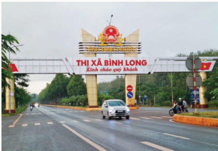
Thị xã Bình Long đang tiến gần tới mục tiêu phát triển đô thị “Bản sắc, sinh thái, văn minh”, xứng tầm trong vùng kinh tế động lực của tỉnh Bình Phước

Để hoàn thành những mục tiêu trên, thị xã Bình Long đã đề ra những nhiệm vụ trọng tâm như: Tiếp tục đổi mới mạnh mẽ mô hình tăng trưởng, cơ cấu lại nền kinh tế, tạo môi trường thuận lợi để thu hút đầu tư, khơi thông các nguồn vốn, thúc đẩy tăng trưởng. Chuyển dịch cơ cấu kinh tế theo hướng nâng cao tỷ trọng các ngành thương mại - dịch vụ, công nghiệp - xây dựng, nông nghiệp ứng dụng công nghệ cao. Quan tâm phát triển kinh tế tư nhân trở thành động lực quan trọng cho sự phát triển của thị xã, tạo lập môi trường thuận lợi cho đầu tư kinh doanh và hoạt động khởi nghiệp, cạnh tranh bình đẳng giữa các chủ thể kinh tế. Tạo điều kiện phát triển và nâng cao hiệu quả hoạt động của khu vực kinh tế tư nhân, khu vực kinh tế có vốn đầu tư nước ngoài và kinh tế tập thể.