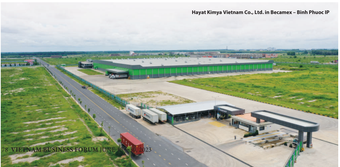
Hayat Kimya Vietnam Co., Ltd. in Becamex - Binh Phuoc IP

Besides, Binh Phuoc's transport infrastructure is also extremely convenient, facilitated by National Highways 13 and 14, Provincial Road 741, My Phuoc - Tan Van Road interconnecting industrial parks with seaports (Thi Vai and Cai Mep), Dong Nai, Binh Duong, National Highway 9, Ho Chi Minh City and Tan Son Nhat