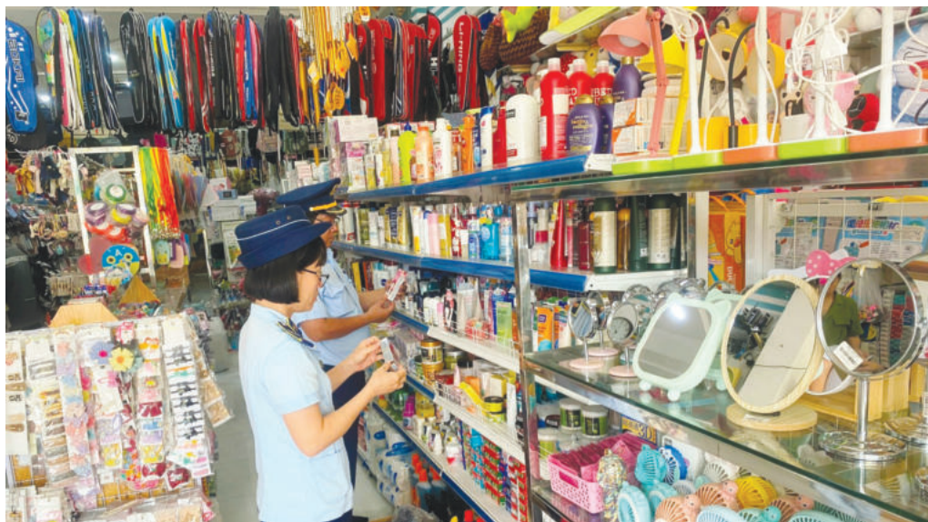
Lực lượng QLTT Bình Phước thực hiện công tác kiểm tra hàng hóa