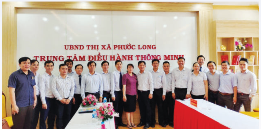
Lãnh đạo VNPT Bình Phước và Lãnh đạo thị xã Phước Long tại Lễ khai trương Trung tâm Điều hành thông minh thị xã Phước Long

Đặc biệt, là đơn vị trực thuộc Tập đoàn VNPT nên ngoài năng lực thực tế, VNPT Bình Phước còn thừa hưởng