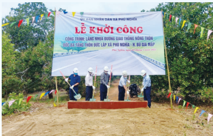
Khởi công xây dựng đường giao thông trên địa bàn xã Phú Nghĩa, huyện Bù Gia Mập

UBND huyện cam kết tạo mọi điều kiện thuận lợi nhất cho các nhà đầu tư, trong đó có các điều kiện pháp lý về đất đai như công tác quy hoạch, kế hoạch sử dụng đất, cấp giấy nhận quyền sử dụng đất. Cùng với đó là các chính sách, khuyến khích ưu đãi, hỗ trợ đầu tư. Với phương châm coi doanh nghiệp là khách hàng, là đối tượng phục vụ, huyện Bù Gia Mập cũng đang tiếp tục chỉ đạo thực hiện tốt các giải pháp cải thiện môi trường kinh doanh, nâng cao năng lực cạnh tranh cấp huyện. ■