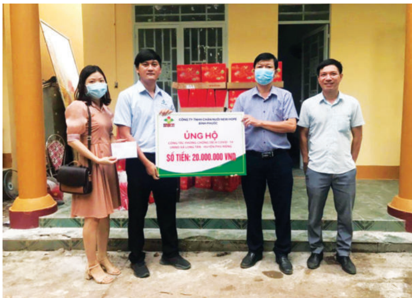
Công ty NewHope tặng quà tại xã Long Tân, huyện Phú Riềng

Không chỉ chú trọng hoạt động sản xuất kinh doanh, New Hope Bình Phước còn quan tâm đến các hoạt động an sinh xã hội. Năm 2021, khi dịch bệnh Covid-19 diễn biến phức tạp, Công ty đã ủng hộ chính quyền địa phương 01 xe cứu thương nhằm