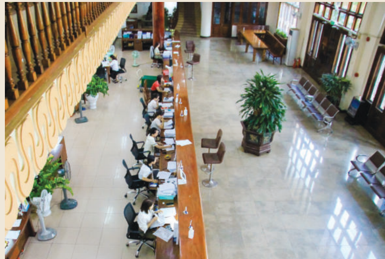
Công chức KBNN tỉnh Bình Phước tiếp nhận, xử lý hồ sơ, chứng từ của các đơn vị sử dụng ngân sách trên hệ thống dịch vụ công trực tuyến

Hiện KBNN tỉnh đã ký kết với 10 NHTM (BIDV, Vietinbank, Vietcombank, MB, SHB, VPBank, MSB, Agribank, LienVietPostbank, ACB) và tiếp tục mở rộng phối hợp thu với các NHTM góp phần tập trung nhanh, kịp thời các khoản thu NSNN của tỉnh. Đây là bước tiến lớn trong