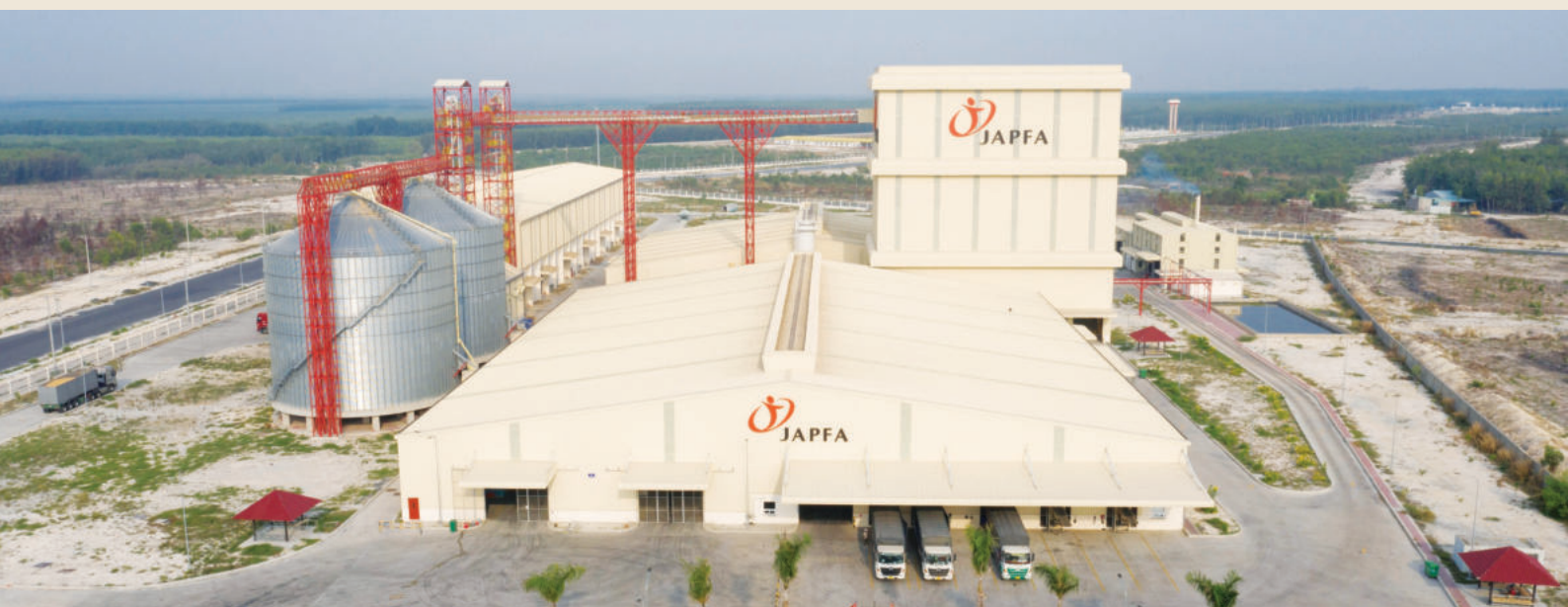
Tổ hợp nhà máy Japfa Việt Nam hiện đại bậc nhất được xây dựng tại Khu công nghiệp Minh Hưng Sikico, xã Đồng Nơ, huyện Hớn Quản, tỉnh Bình Phước