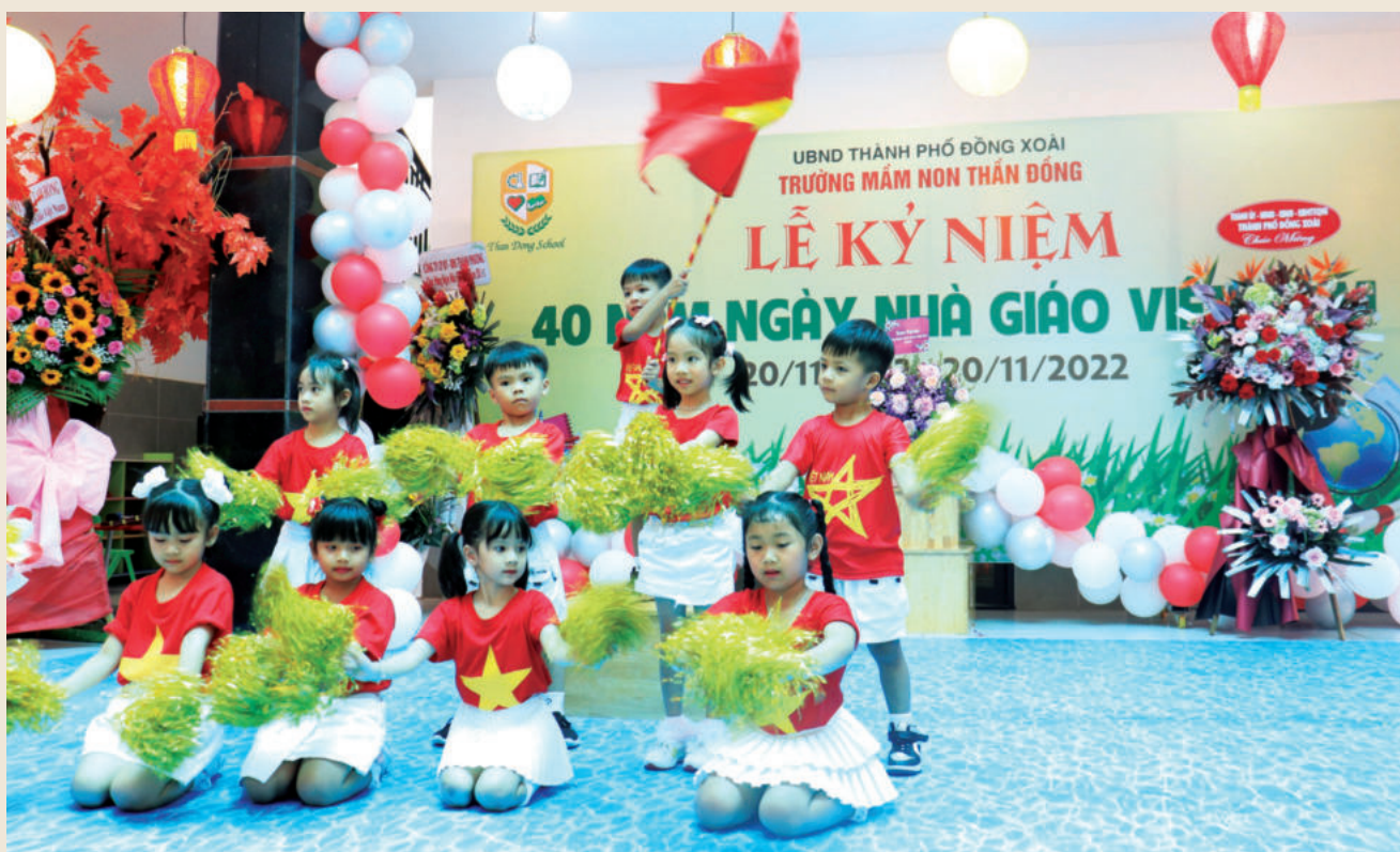
Many facilities of Than Dong education system in Binh Phuoc province