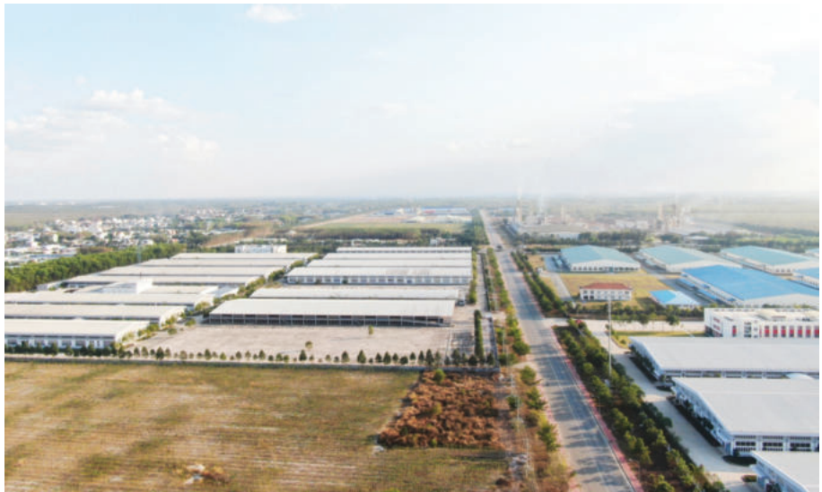
Minh Hung III Industrial Park

Hence, investment promotion has been gradually reformed by the authority to enhance the quality of contents and methods and diversify partners. The authority has actively approached investors and major markets that can unlock locally potential industries and fields. Apart from traditional partners such as Japan, South Korea, Taiwan and Singapore, the authority has also expanded its scale and focus on overseas Vietnamese doing business and living abroad, to invite them to study and invest in the province.