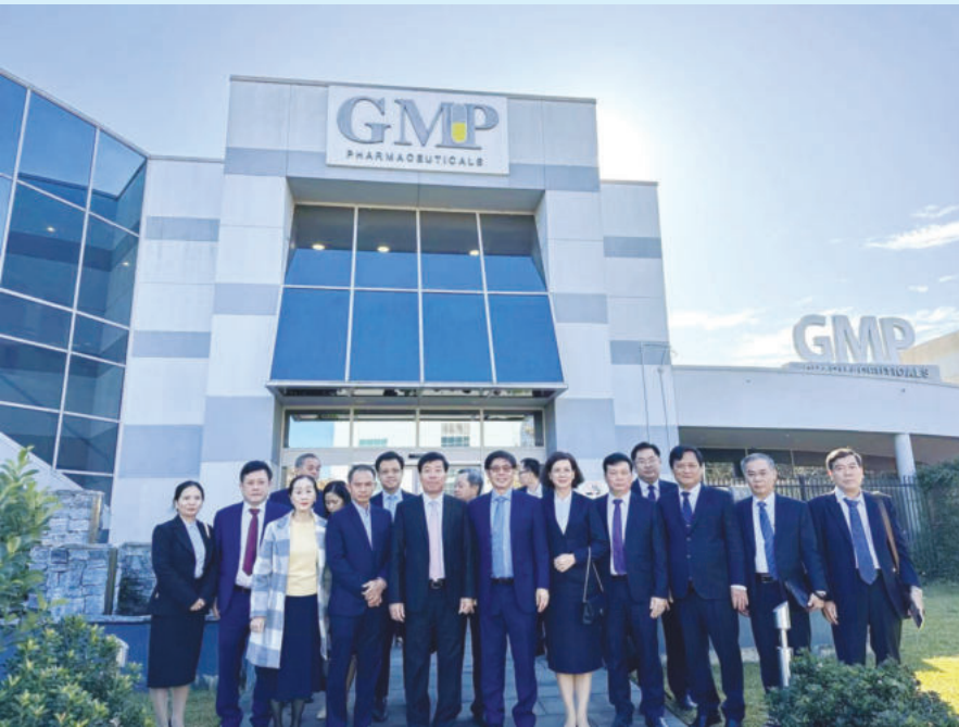
Binh Phuoc province's delegation paid a working visit to GMP Pharmaceuticals within the framework of the trade promotion program in Australia

Could you please introduce some outstanding results of industrial zone infrastructure, electricity infrastructure and commercial infrastructure development of the sector in the past time?