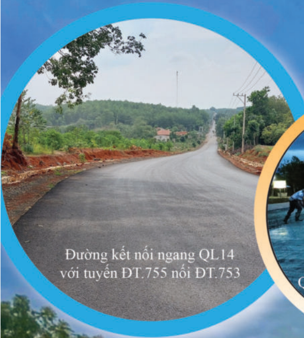
Đường kết nối ngang QL14 với tuyến ĐT.755 nối ĐT.753