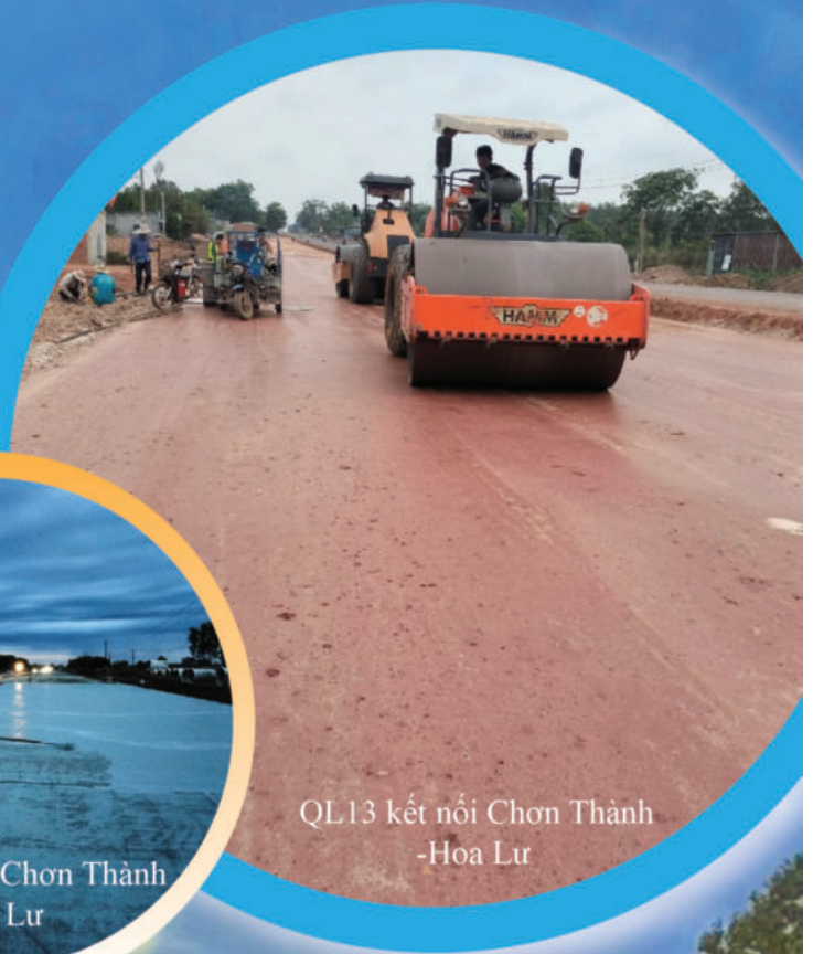
QL13 kết nối Chơn Thành -Hoa Lư