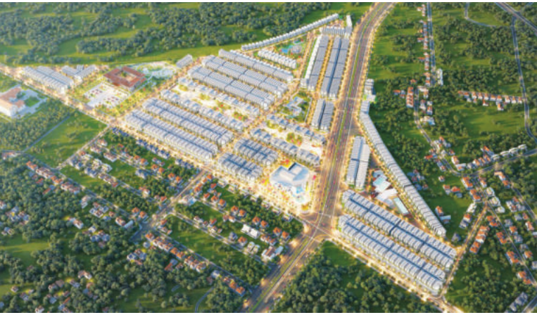
Diamond City – Dự án thay đổi diện mạo của huyện biên giới Lộc Ninh