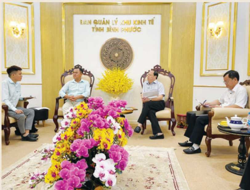
Lãnh đạo Ban Quản lý Khu kinh tế tỉnh Bình Phước tiếp nhà đầu tư

Tiếp tục cải thiện môi trường đầu tư, nâng cao năng lực