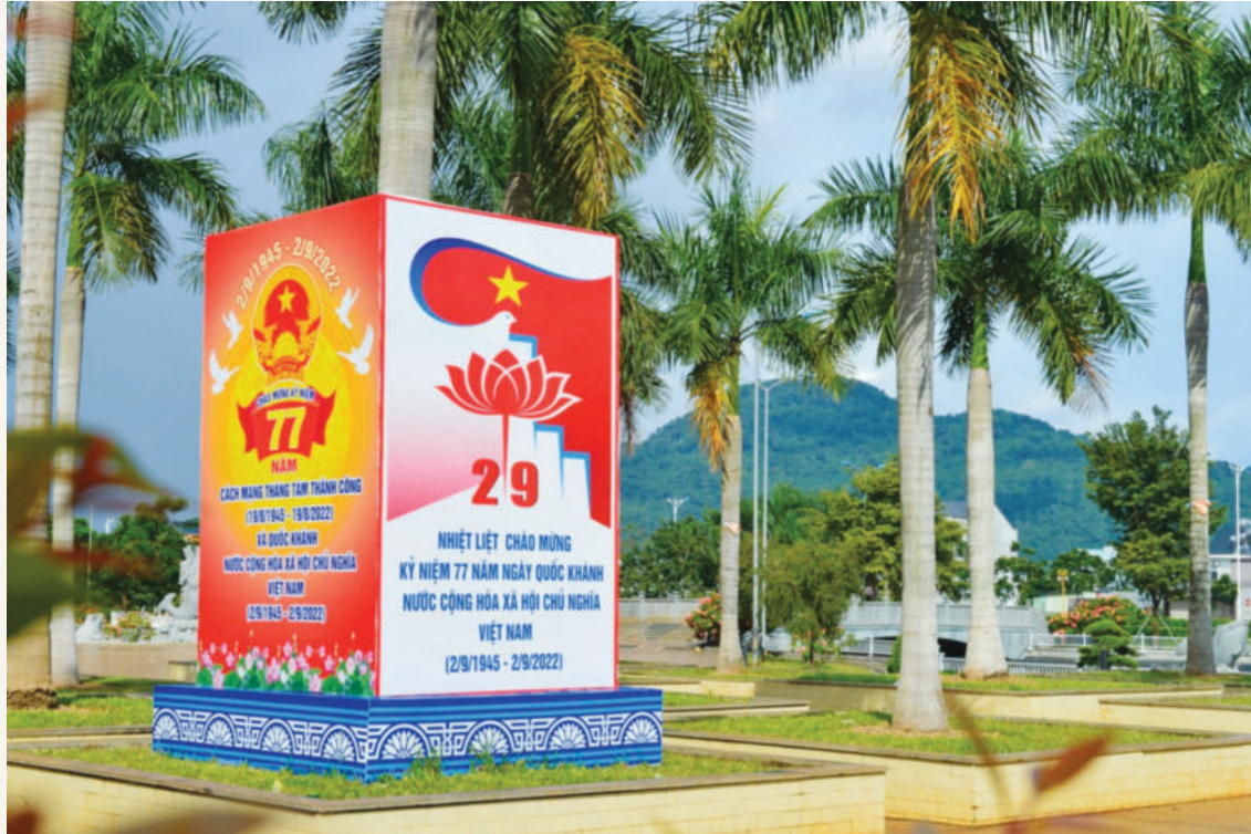
Quảng trường 6.1 tại khu vực Trung tâm hành chính thị xã Phước Long