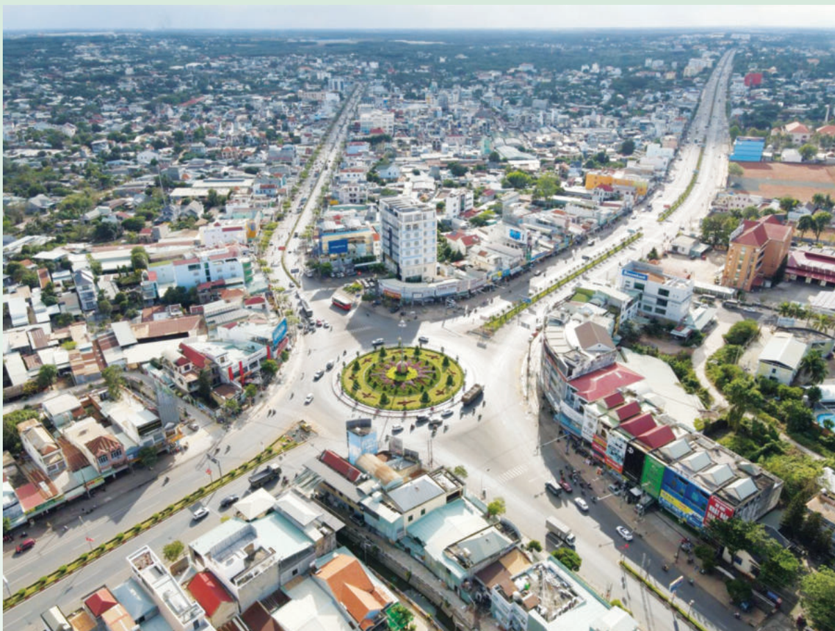
Thu NSNN trên địa bàn TP.Đông Xoài tính đến ngày 28/6/2023 đạt 48%

Tài chính đã đề ra một số nhiệm vụ và giải pháp như: