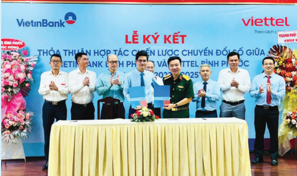
Vietinbank và Viettel ký kết hợp tác

dịch vụ nhằm gia tăng năng lực cạnh tranh và góp phần tháo gỡ khó khăn, nâng cao hiệu quả kinh doanh cho doanh nghiệp, người dân.