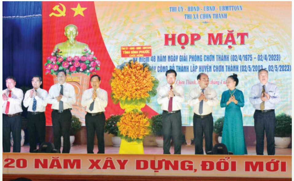
Lễ kỷ niệm thị xã Chơn Thành 20 năm xây dựng, đổi mới

Thứ năm, kết cấu hạ tầng được đầu tư, hoàn thiện, đồng bộ. Công tác quy hoạch và chỉnh trang đô thị được quan tâm, diện mạo nông thôn đã dần chuyển sang mô hình đô thị theo hướng khang trang, hiện đại.