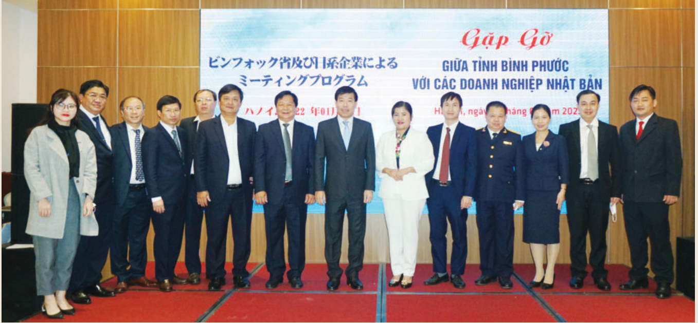
Chairwoman of Binh Phuoc Provincial People's Committee Tran Tue Hien at a working session between Binh Phuoc province and Japanese businesses