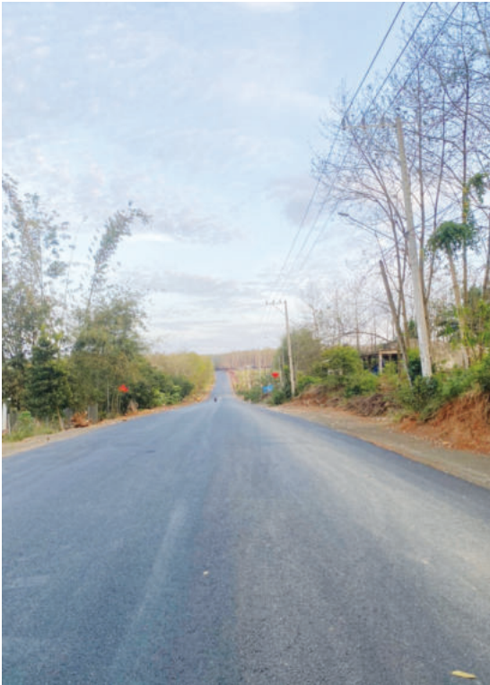
Đường kết nối ngang QL14 với tuyến ĐT.755 nối ĐT.753